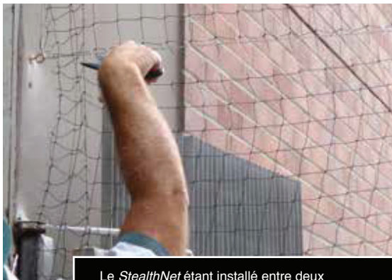
Le StealthNet étant installé entre deux bâtiments pour éloigner les pigeons des équipements sensibles.