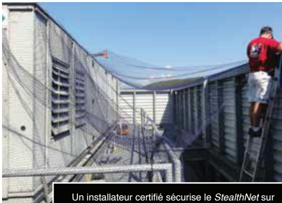
Un installateur certifié sécurise le StealthNet sur le système HVAC d'un hôpital pour exclure les oiseaux.